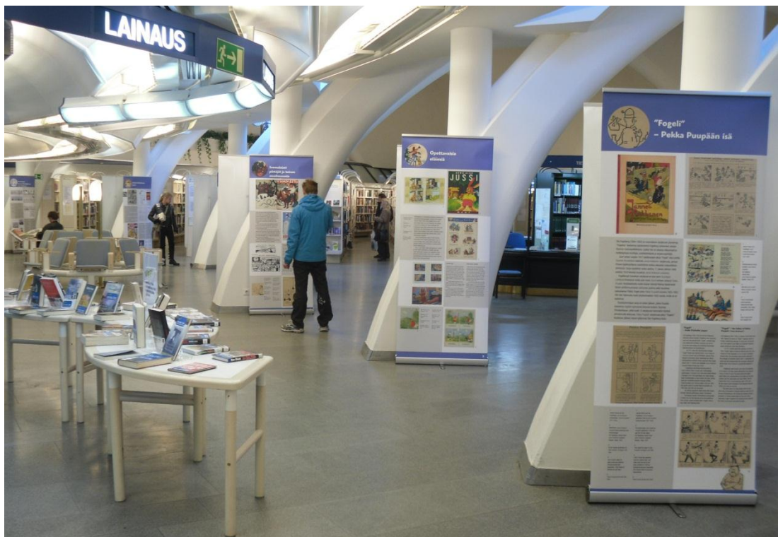
Kiertonäyttely Tampereen pääkirjasto Metsossa.

Kansalliskirjaston näyttelyn pohjalta toteutettiin roll-up-tekniikalla kiertonäyttely. Kiertonäyttely oli olennainen osa juhlavuotta, ja sillä tavoitettiin valtakunnallisesti ihmisiä jotka eivät pääse pääkaupunkiseudulle osallistumaan näyttelyihin. Juhlavuoden kiertonäyttely Rymy, raikua, ärräpäitä - Vuosisata suomalaista sarjakuvaa lähti liikkeelle huhtikuussa 2011 kiertää vielä vuonna 2012, yhteensä ainakin kahdeksallatoista paikkakunnalla. Helpporakenteista ja mukautuvaa näyttelyä esiteltiin erityisesti kirjastoissa, joissa ei välttämättä ole erillisiä näyttelytiloja. Kiertonäyttelyn yhteyteen paikallisia näytteilleasettajia kehoitettiin kokoamaan alueen sarjakuvaa, järjestämään tapahtumia kuten luentoja, työpajoja ja työnäytöksiä. Useissa paikoissa kiertonäyttely olikin osa paikallista tapahtumaa, kuten Kemin sarjakuvapäiviä, Sastamalan vanhan kirjallisuuden päiviä ja Kuopion Kirjakanttia.