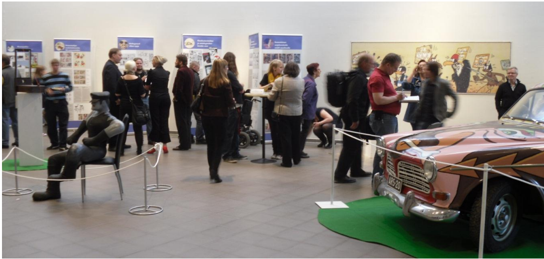
Kemin sarjakuvapäivät 30 vuotta -näyttelyn avajaiset.

Turun Logomossa esiteltiin puupäähatullakin palkitun sarjakuvantekijä Tom of Finlandin teoksia. Yksittäiset taiteilijat ja taiteilijaryhmät järjestivät näyttelyitä ja kiertonäyttelyitä kirjastoissa, gallerioissa, kahviloissa ja muissa näyttelytiloissa. Helsingin sarjakuvakeskuksessa ja Turun sarjakuvakaupassa vaihtuivat näyttelyt kuukausittain. Yhteenlaskettuna sarjakuvaa sisältävien näyttelyiden määrä ylittääkin sata näyttelyä. Liitteenä lista tiedossa olevista sarjakuvanäyttelyistä, sarjakuvantekijöiden näyttelyistä ja näyttelyissä joissa on ollut mukana sarjakuvaa. Listauksen perusteella voidaan laskea että, vähän alle puolet näyttelyistä on ollut Helsingissä ja muut näyttelyt muualla Suomessa.