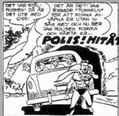
Teräsmiehen poika (sic!) hallitsee sujuvasti toisenkin kotimaisen.

Kysypä Keräilyliike Kulku-Katin pojasta, Läntinen Brahenkatu 12, Hki. Siellä myytävän teoksen "Sarjakuvat. Hinnasto 1998-2000" mukaan suurin osa maksaa hyväkuntoisina 35 mk/kpl, 60-l alkupuolen Teräsmiehen poika-lehdet 50 mk tai 70 mk/kpl. Hyväkuntoiset vuosien 1960-62 Aku Ankat ovat 50 mk/kpl.