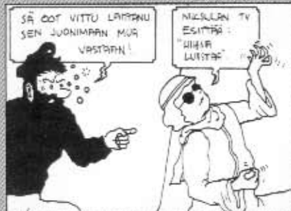
Hintin seikkailut: Mustan dullan maa