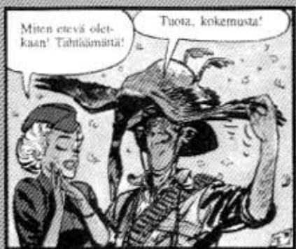
Charlierin ja Uderzon Haikaralaivueesta ei huumoria puuttunut.

http://www.egmont-kustannus.fi tai läheta sähköpostia: palaute@egmont-kustannus.fi .