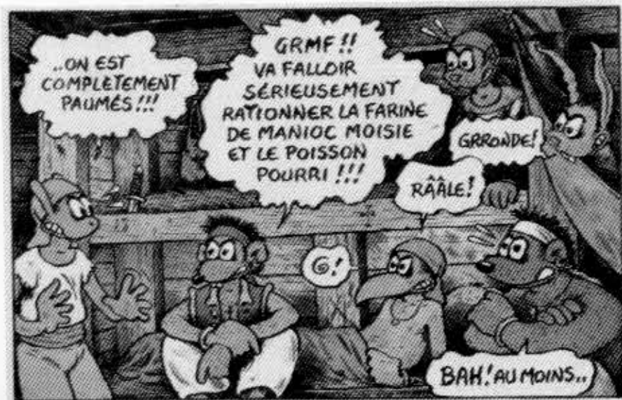
Parhailaan Jano tekee uutta tarinaa portugalilaisista meriurhoista matkalla Intiaan.

En halunnut tulla luokitelluksi mieheksi, joka tekee vakavia, miltei kansantieteellisiä tarinoita Afrikasta. Siksi tein Kémi-albumin, joka on puhdasta hauskanpitoa.