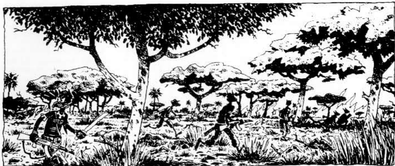
Julkaisematon kuva Sudanin sisällissodasta.