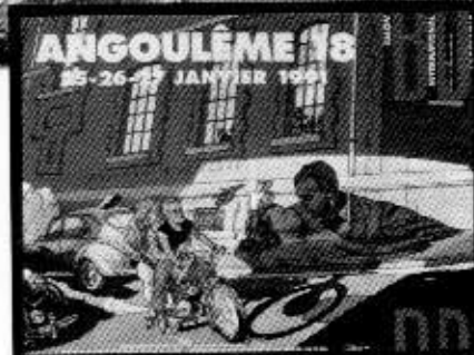
Angoulèmen festarijulistte vuodelta 1991.

Cabanesin ja Cauvinin 62-sivuinen dekkari-albumi ilmestyy syyskuussa Ranskassa ja se julkaistaan sitä ennen jatkikse- na uudessa ranskalaisessa sarjakuvalehdessä BoDoissa. Tämän dekkaritarinan jälkeen Cabanes aikoo tehdä heti perään vielä toisen dekkarijutun. Dekkaritarinoissa Cabanes siirtyy myös käyttämään perinteistä väritystekniikkaa, jossa musta viiva tehdään eri paperille kuin värit. Sokkoleikistä alkaneen oma-