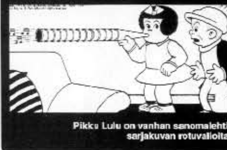
Pikku Lulu on vanhan sanomalehtisarjakuvan rotuvalloita.