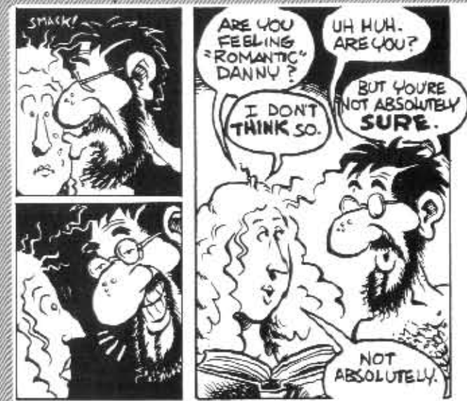
Slacker-pariskunta Eno ja Plum.