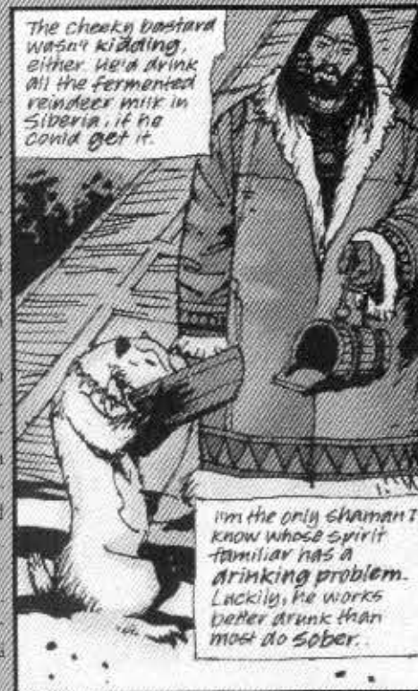
Muktuk Wolfsbreath on kovaksi keitetty shamaani.

Plan Vertigo antoi LaBanille ensimmäisen oman sarjan (1998), jossa Muktuk Wolfsbreath selviää omista syövästä leikkurimarkkinan arvoitusta. Mukana on tietenkin myös