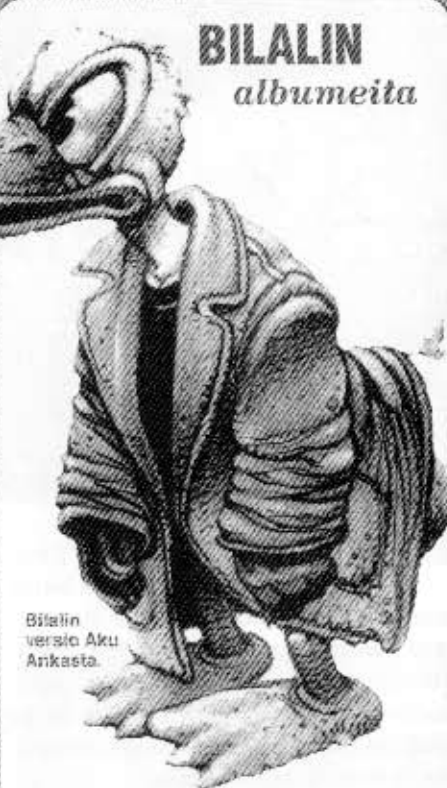
Bilalin versio Aku Ankasta.