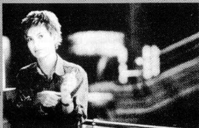
Oikealla stili-kuva elokuvasta Bunker Palace Hotel . Alla toiminnas elokuvassa Tykho Moon .

Bilal onkin tarttunut innokkaasti uuden tekniikan tarjoamiin