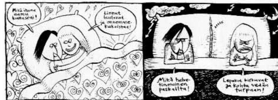
Kati Kovács: Vuoteen omat - ja vieraat