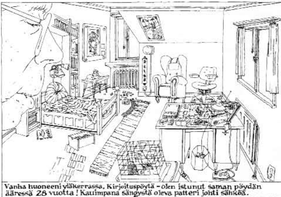
Vanha huoneeni yläkerrassa. Kirjoituspöytä - olen istunut saman pöydän ääressä 28 vuotta! Kauimpana sängystä oleva patteri johti sähköä.

Meitä kustaan silmään oli yksi sarjakuvasyksyn tapauksista, 128 sivua täynnä