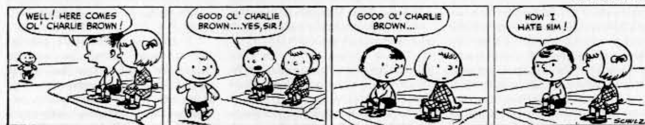
Ensimmäinen Tenavat-strippi (2.10. 1950) kiteyttää jo sarjan hengen.

Omissa puheissaan Schulz ei ollut sokerihuurteinen. Hän oli kiukkuissaan, koska Truman voitti Deweyn vuoden 1948 tiukoissa presidentinvaaleissa. Työssä demokraattikollega kysyi häneltä: "Miten nukuin viime yön?". Schulz huokaisi: "Nukuin yöni ihan kohtuullisesti. Mutta päivät tuntuvat vaikeilta." Heti sanottuaan lauseen Schulz tiesi, että tilanteesta syntyisi maukas pilakuva, joten hän piirsi ja myi sen. Hänellä oli kykyä tehdä turhaumista taidetta.