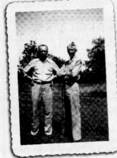
Charles Schulz uniformissa isänsä kanssa.