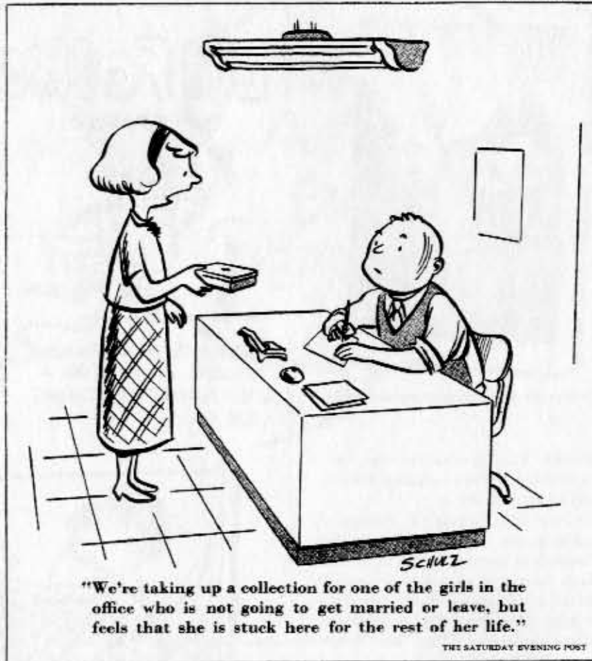
Schulzin Pilakuva Saturday Evening Postista (18.2. 1950).

Armeijassa Schulz käsitteli yksinäisyyttään ja äitinsä kaipuuta kääntymällä uskonnon puoleen. Euroopassa hän todella takertui siihen, kun hän oli todistamassa sodan loppua ja palveli divisioonassa, joka löysi Dachau. Kun Schulz palasi kodin ankeisiin oloihin, hän edelleen tukeutui uskoon. Hän jätti luterilaisuuden ja liittyi paikalliseen fundamentalistisempaan liikkeeseen. Siitä tuli hänen elämänsä keskus – jopa siinä määrin, että Schulz alkoi julistaa sanaa kadunkulmissa.