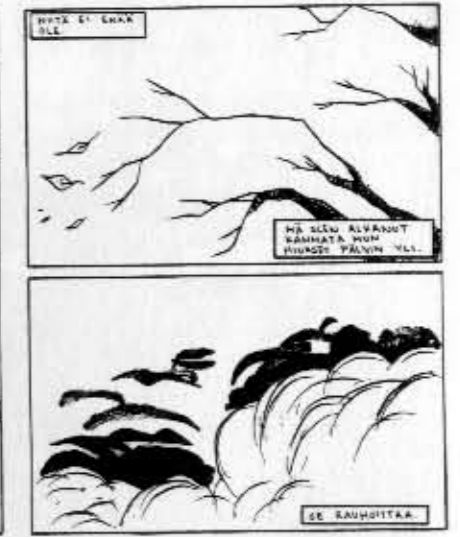
Valitut sarjat tiristää esiin kotimaisten sarjakuvaramaaniin ytimen.

Galleria Rajatilan yhteyteen Tampereelle avataan kesäkuussa oma- ja pienkustanteiden markkinointia ja levittämiseen tarkoitettu myyntiliike. Toiminnan tarkoituksena on parantaa tietoisuutta monipuolisesta ja aktiivisesta alakulttuuritoiminnasta sekä tuoda teoksia esille. Samalla Rajataide ry perustaa oma- ja pienkustannekokoelman. Teoksia voivat tarjota levytykseen kaikki alasta ja toteutustavasta riippumatta. Lisätietoja: www.rajataide.fi