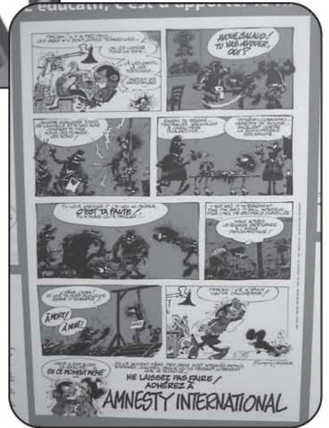
Niilon leppoisa maailma ja Mustat sivut miksautuvat Amnesty Internationalille tehdyssä kampanjajulistuksessa.

Vähitellen pahin väistyi, mutta Franquin ei enää koskaan palannut entiselleen. Kokonaisen sarjakuvavisun piirtämisestä tuli ylivoimainen urakka. Franquinin viimeinen suuri työ oli kehitellä Tifou-animaatiosarjan mikroskooppinen maailma. Hän piirsi lähes tuhat A4-sivua luonnoksia pähkinänkoisten Tifouden vapaan absurdista elämästä vuonna 1989, ennen kuin lasi kynän lähes lopullisesti käsistään. André Franquin kuoli 5. tammikuuta 1997, vain kaksi päivää 73-vuotispäivänsä jälkeen. Hänen elämäntyönsä on massiivinen perintö, joka heijastuu Hergén tuotannon tavoin ikuisesti koko eurooppalaiseen sarjakuvakenttään. ”En pysty olemaan pitkään poissa piirustuspöydän luota. Siellä asiat ovat olemassa. Siellä minä olen olemassa.”