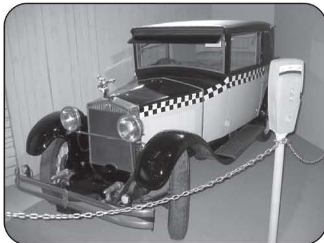
Pielisen auto ei ole T-malli Ford vaan Fiat 509.

science et industrie EXPO LE MONDE DE Franquin MARSU oct. 2004 / août 2005 production franquin.com