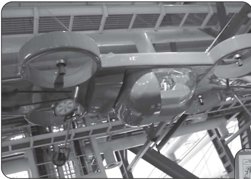
Zorkopteri oli kiinnitetty kattoon.