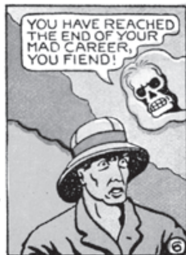
Fantomah muuttuu kostavaksi päkalloksi.