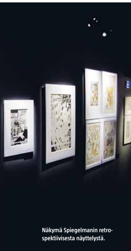
Näkymä Spiegelmanin retrospektiivisestä näyttelystä.