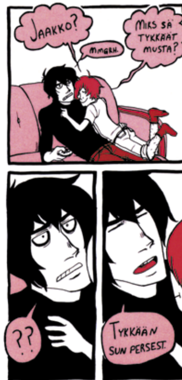
TENTA LOVE LUKU 1: IDIOOTTI JA REALISTI © TEAM PÄRVELÖ

Sarjakuvataiteilija mainitsee saaneensa vaikutteita niin Looney Tune-sista kuin Muppet Showsta , ja kieltämättä tiettyjä yhtäläisyyksiä edellä mainittuihin sarjoihin onkin havaittavissa, anarkistista ja hupaisaa kun meno on. Sarjakuvahahmojen salaisten seikkailujen lisäksi tekijältä on ilmestynyt niin ikään tutustumisen arvoinen pienlehti Cleaning Is for Hipters .