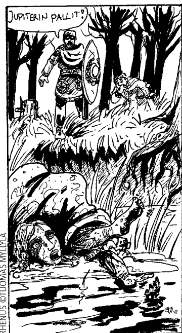
RHENUS OULUOMAS MYLLYÄ

Lähestulkoon täyden kympin suoritus sekä tekijältä että aloittelevalta kustantajalta, kautta Teutateksen!