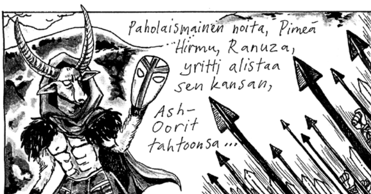
RAUHA KOLMEN KORVAN KANSALLE. OSA 1.