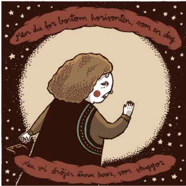
Yli 60 ruotsalaispiirtäjää teki sarjakuvamuotokuvia Kolehmaisena kunniaksi.