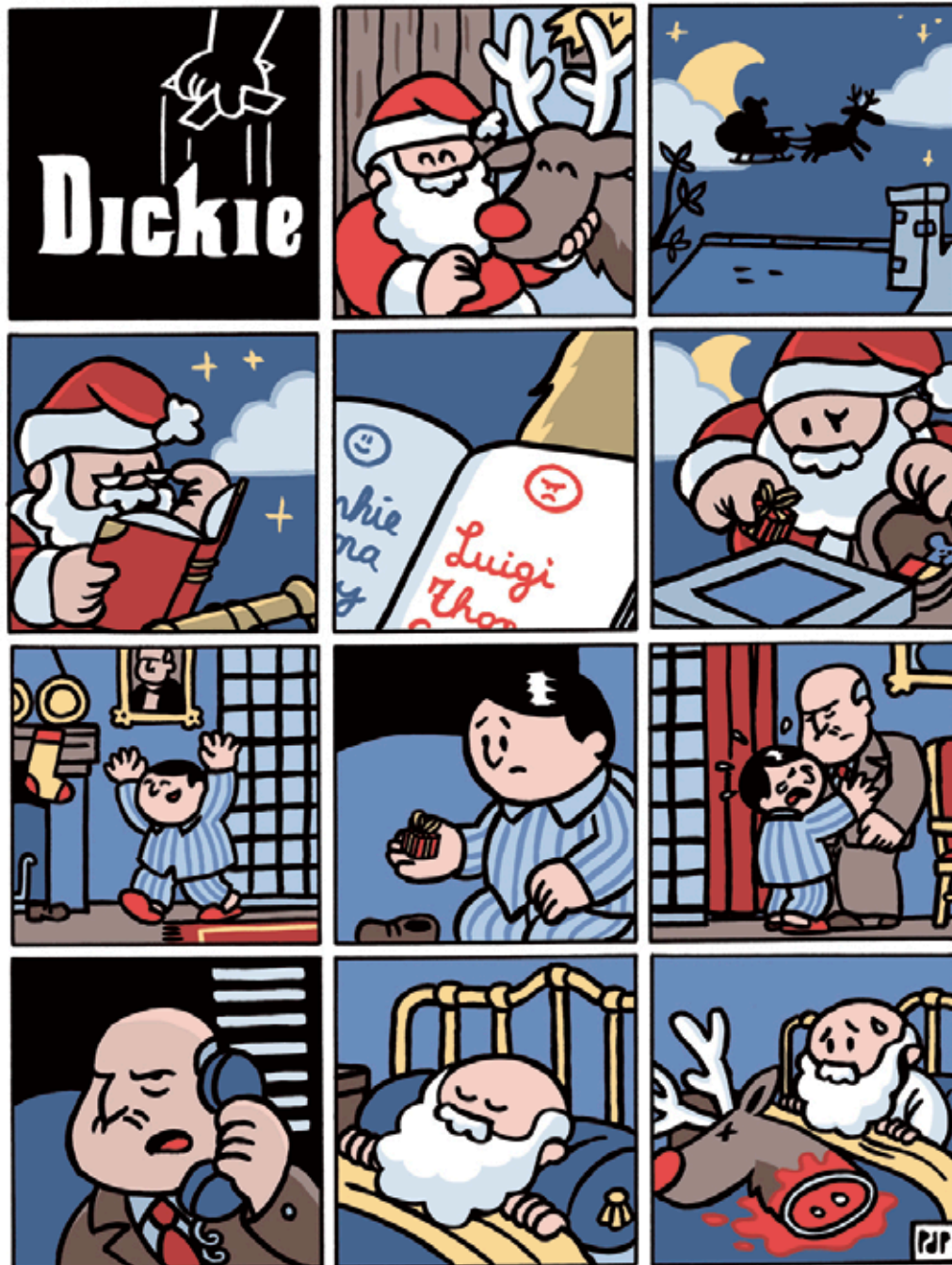
Joulu-Dickie ja Petterin parempi kuolema.