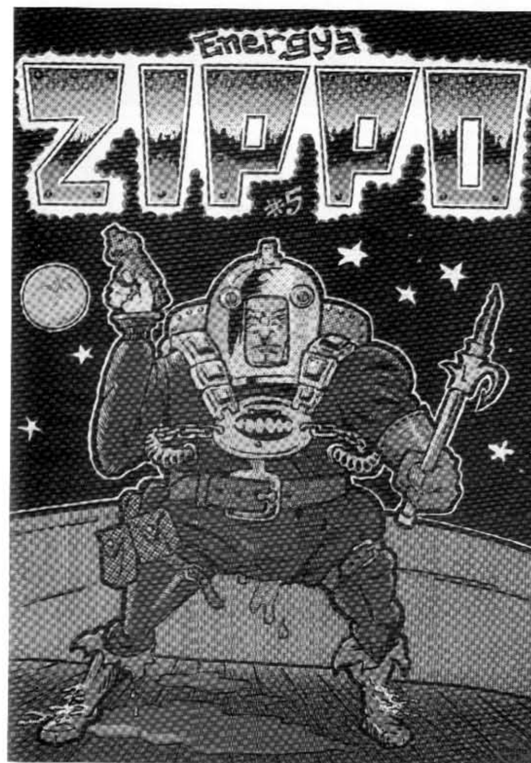
Zippo n:o 4