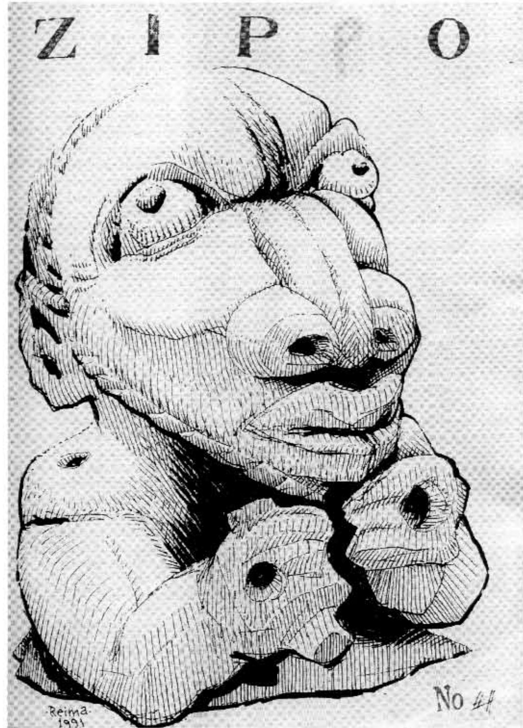
Zippo n:o 4.

Sarjariin (Tampereen sarjakuvaseuran lehteen) olen piirtänyt melkein jokaiseen numeroon. Tykkään tehdä usean sivun juttuja, ja sinne olen tehnyt monet mun parhaista töistä.