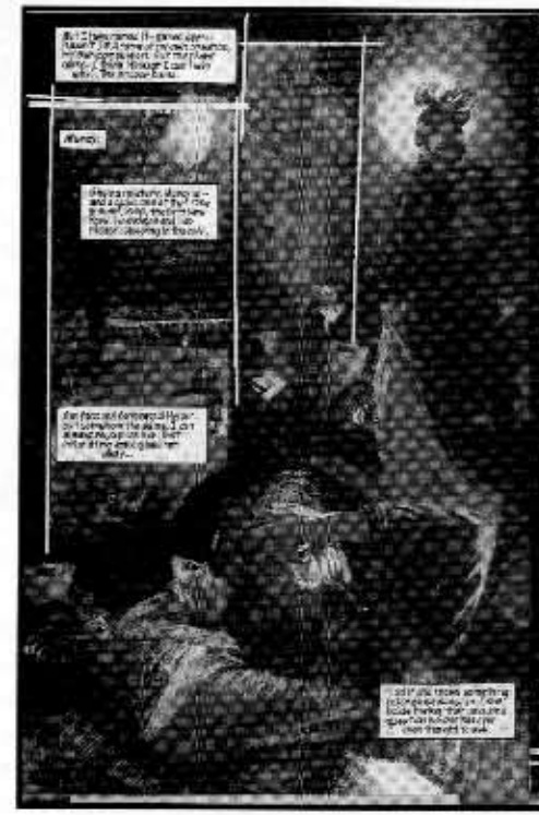
Mercy, J.M. DeMatteis, Paul Johnson

(hyvin usein se on rasittavaa), mutta vain uudenlaiset sarjat pystyvät tuomaan muassaan maailmaamme jotain merkittävää.