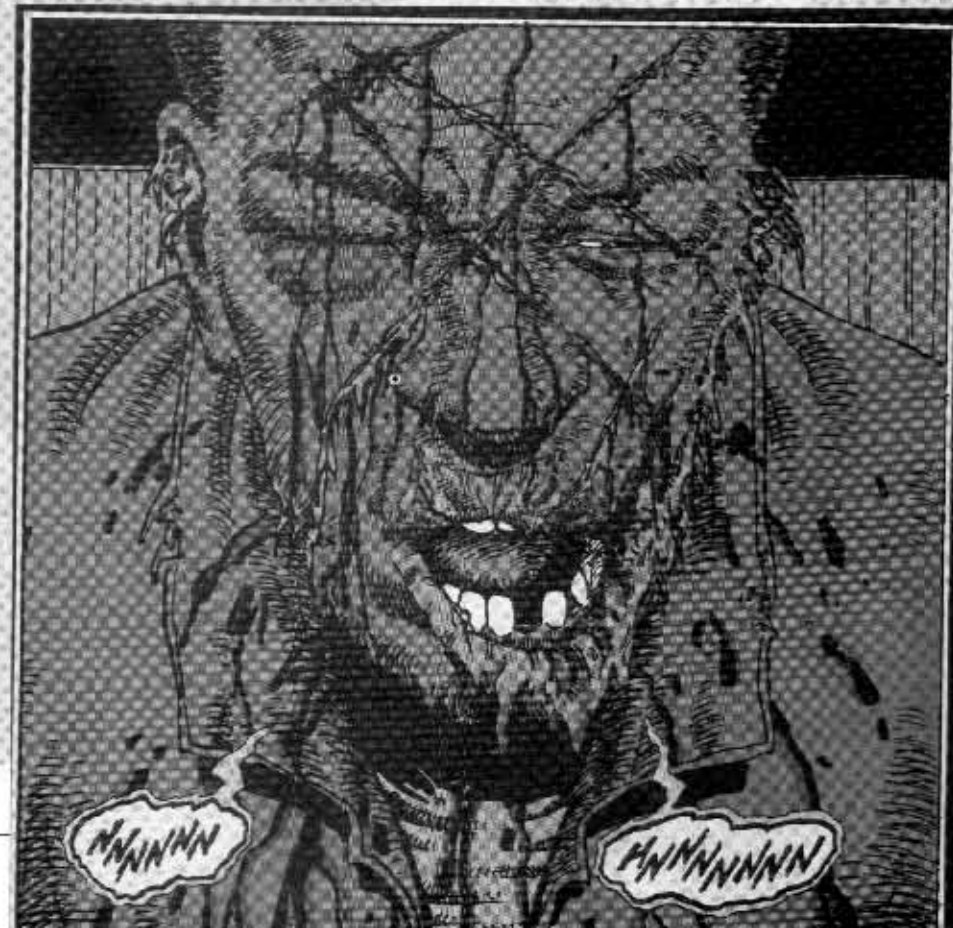
London kills me, Garth Ennis ja Steve Dillon, Hellblazer 65