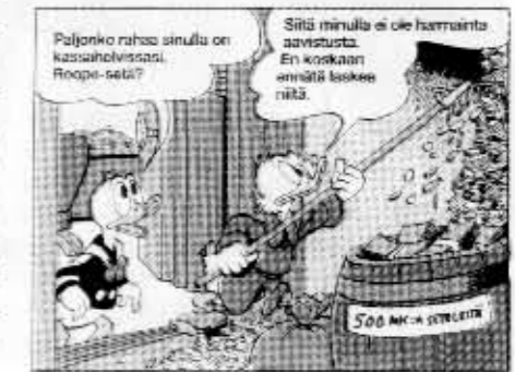
Roope Anka: "Pihtari."

Lisäksi vastaajat mainitsivat suosikkineen muutamia marginaalisempia ankkalinnalaisia: muutamat pitivät helpoimpana samastumista Mummo