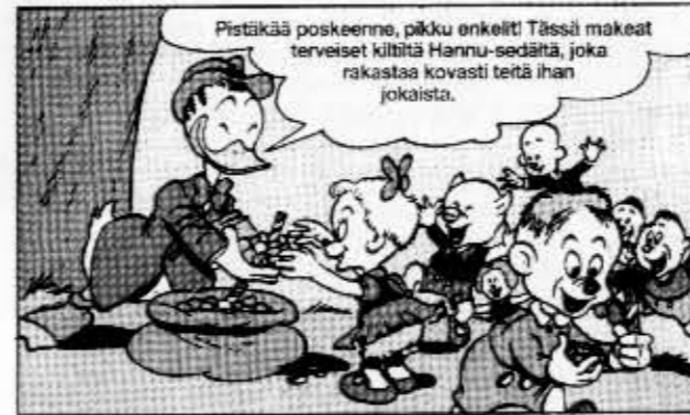
Hannu Hanhi: "Leuhka."

Pitkästi kuvailtiin myös Akun setää. Roope on tunnetusti maailman rikkain anka. Lisäksi tämä miljoonikko, pankkiiri ja liikemies on kitsas, penninvenyttälä, pihtari, saita, kitupiikki, pihi ja itara. Tunnetuin Roopen toiminnoista on rahoissa uiskentelu. Roope on, paitsi rakastunut rahoihinsa, myös itseks, itserakas ja itsesäällissä