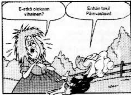
Mummo Anka: "Naiivi vanha kääpä."

Aku herää raivostuttavan kellon pärinä. Hän heittää kellon ikkunasta ja jatkaa uniaan, mutta pojat herättävät Akun. Aku juoksee töihin, missä hänen työnään on poimia roskia säilytettään purkeista. Yhdessä purkissa ollut ampiainen vihastuu Akulle. Aku alkaa huiskia ampiaista hatullaan, jolloin ampiainen jää hattuun ja pistää Akua. Aku hyppii raivoissaan ja saa potkut. Kotona Aku etsii uutta työpaikkaa. Alkuperäisin sanoin: "Heräsin aamulla herätyskellon päätärepivään kilinään. Nostin nyrkkini ja rämytin kellon palasiksi, heitin sen ikkunasta ja nukahdin. Jouduin kuitenkin nousemaan ylös pian, koska Tupu, Hupu ja Lupu tulivat repimään minua räpylöistä töihin..."