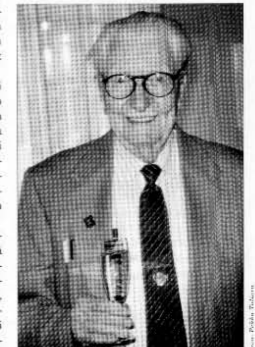
Reipas vanha herra Carl Barks.

Nyt uutta kerrottavaa oli sen verran, että Barks esitti kopion seuraavasta myyntiserigrafistaan. Sekin on eräänlainen 60-vuotisjuhlaesine. Serigrafissa joukko lukijan kannalta keskeisiä ankkalinnalaisia on keraantyy-