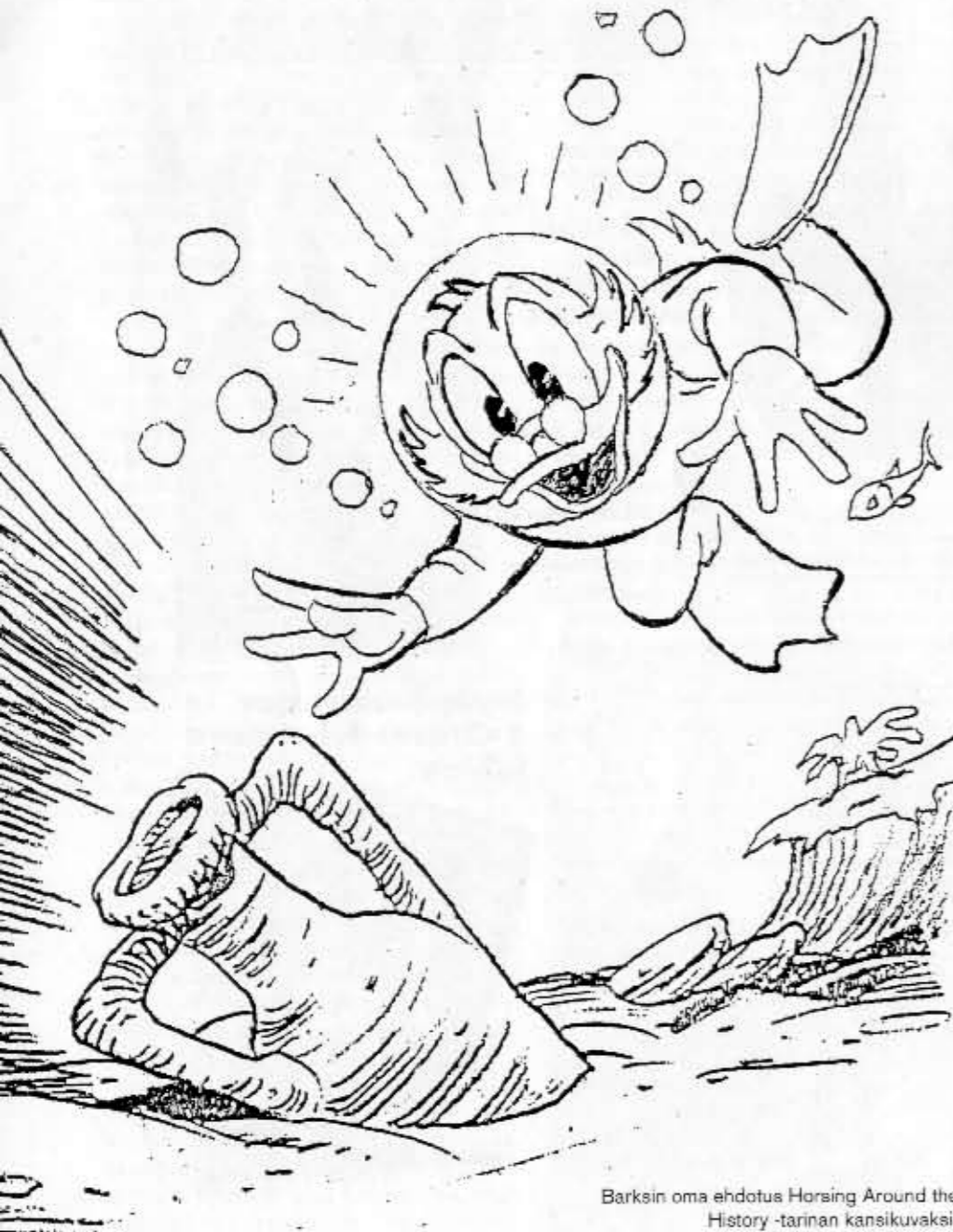
Barksin oma ehdotus Horsing Around the History -tarinan kansikuvaksi.