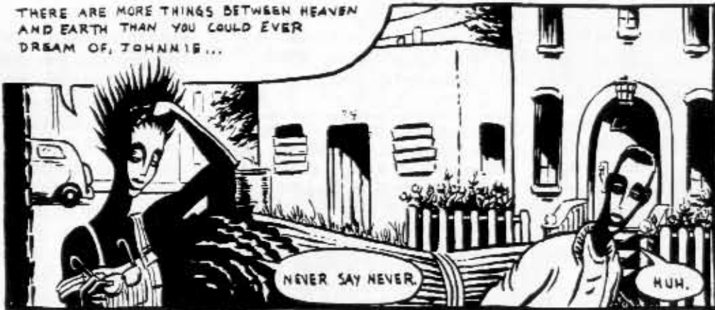
Drawn & Quarterly: Graham Chaffeen Johnny and Babe