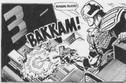
JUDGE DREDD