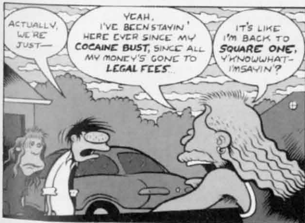
Jimmy Foley - epätodennäköinen tähti

En tiedä. Voisin tulla ottamaan sinusta kuvan...O