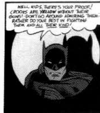
Bob Kanen Batman.

Batmanin keksijä ja alkuperäinen piirtäjä Bob Kane kuoli viime marraskuun 3. päivänä Los Angelesissa. Kane oli syntynyt New Yorkissa 24.10.1916. Batman puolestaan syntyi vuonna 1939. Kane aloitti piirtäjän uransa Eisner/Iger-studiolla, joka edelsi Will Eisnerin Spirit-aikoja. Ennen Batmania hän työskenteli myös Fleischerin veljesten Betty Boop -animaatiosarjassa. Myös muiden kuin Kanen on väitetty osallistuneen Batmanin hahmon kehittelyyn alkuaikoina.