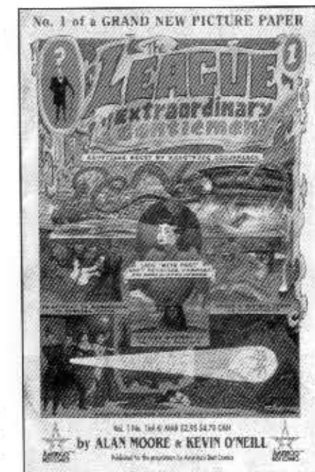
Taattua pulp-estetiikkaa Alan Mooren ja Kevin O'Neilin malliin.

Brittiläinen käsikirjoittajaguru Alan Moore on palannut Helvetistä-sarjan jälkeen Englannin menneisyyteen uudessa The League of Extraordinary Gentlemen -lehdessään, jota on tätä kirjoitettaessa ilmestynyt kaksi numeroa. Sarjan kustantaa America's Best Comics ja piirtäjänä on mm. Nemesiksestä ja Marshall Law'sta tuttu Kevin O'Neill. America's Best Comics aikoo julkaista jatkossa lisää tavaraa Mooreelta. Seuraava uusi julkaisu on huhtikuussa ilmestyvä Tom Strong -lehti.