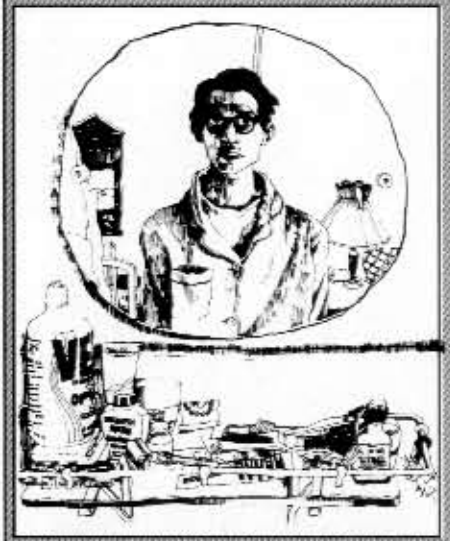
Nuori Robert Crumb.

Redartekä milloin viimeinen Zap-lehden numero ilmestyi? Siis sen läpyskan, jonka Robert Crumb aloitti 60-luvulla undergroundin alkubämärissä ja jossa monet undergroundin suurimmat esiintyivät? Ai joskus vuosia sitten? Höpö höpö. Zap 14 ilmestyi viime syksynä. Isoimmista mukana olivat S. Clay Wilson ja Victor Moscoso, mutta muitakin vanhoja tattuuta vilahdelee sivuilla. Kustantaja oli underground-pulju Last Gasp.