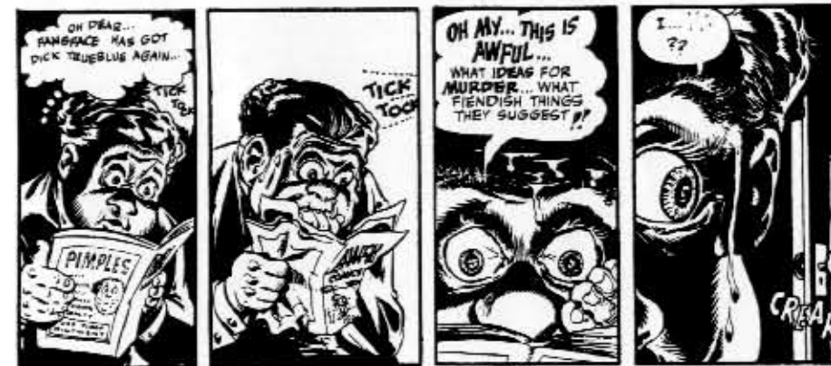
Moralistisia sävyjä sisältänyt amerikkalainen sarjakuvakeskustelu näkyi meilläkin. Oheessa Will Eisnerin näkemys aiheesta.

Loppujen lopuksi eduskunta hyväksyi lakimuutoksen marraskuussa 1956. Vastauksessaan hallituksen esitykseen eduskunta kuitenkin toisti lakivaliokunnan näkemyksen, että hallituksen on ryhdyttävä mitä pikimmiten toimiin sarjakuvien levittämisen rajoittamiseksi.