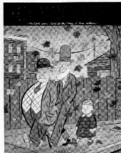
Comic Art, Vol. 1, Number 1, 2002.

Comics Coden luhistuttua lopullisesti suuret amerikkalaiskustantamot ovat innostuneet kosiskelemaan yleisöä sensuurin ennen kieltämällä konsteilla. Nyt kun seksi ja väkivalta ovat valtavirtasarjakuvissa arkipäiväistyneet, yritetään huomiota herät-