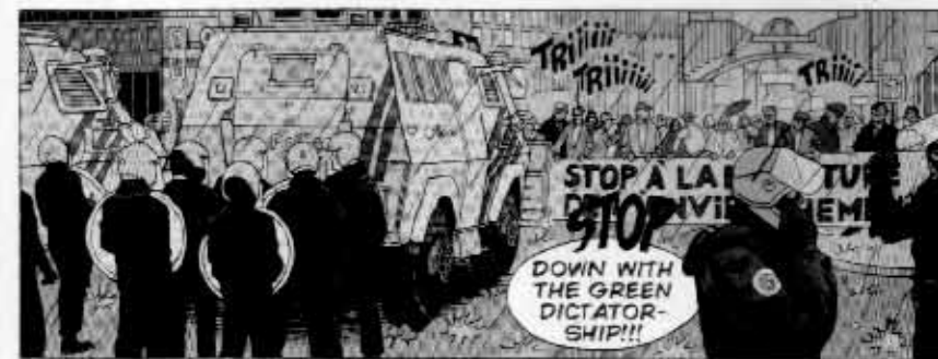
Kemianteollisuutta ei saa arvostella EU:n rahoilla.