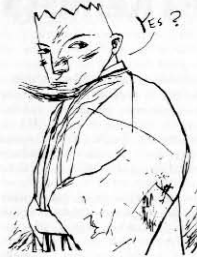
Dave McKean, s. 16