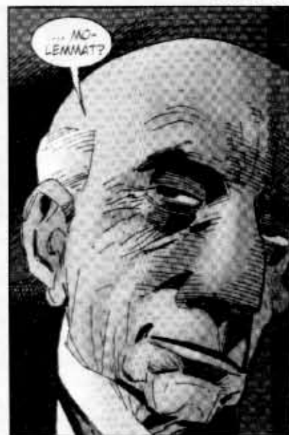
Sherlock Holmesin arkkivihollinen, professori James Moriarty.

ajankohtaisimman lauseen: "Joskus yhteiskunnalle on hyödyksi luoda omat vihollisensa."