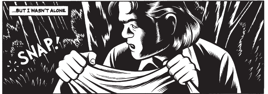
Teini-ian iho-ongelmia Burns'n malliin.

Sen sijaan hän tekee yhden episodin ranskalaiseen animaatioelokuvaan Fear(s) of the Dark (Peur[s] du noir). Siinä eri sarjakuvataiteilijat ohjaavat painajaisuniin perustuvia lyhytanimaatioita. Muita osioita tekevät muun muassa Dupuy & Berberian ja Lorenzo Mattotti.