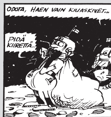
Suomi Kuussa, Q-ukko huitaisi pontikat huiviinsa.

saa. Pajatson piti lisäksi ilmestyä kahdeksan kertaa vuodessa ja kun ensimmäisessä numerossa oli kansien lisäksi 64 sivua, materiaalin tarve oli selvästikin pohjaton.