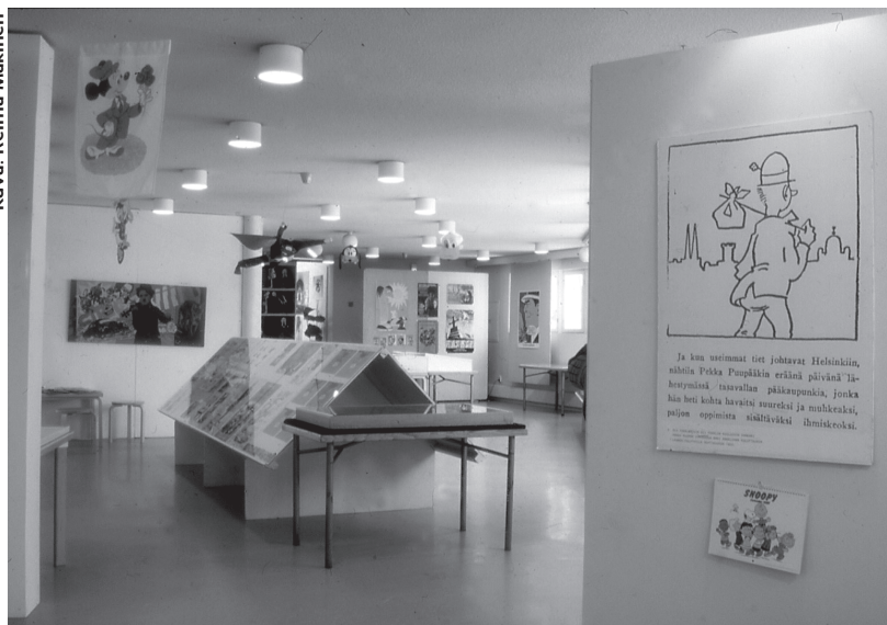
Sarjakuvanäyttely kirjaston lehtilukusalissa vuonna 1980.