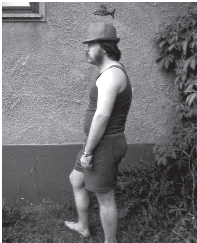
Kuva: Reima Mäkinen

Uusien ideoiden valossa kaikki vaikutti lupaavalta. Kokouksissa kaavailtiin jäsenhankintakampanjaa ja filmi-iltoja. Oli tarkoitus aloittaa jäsenille sarjakuvien