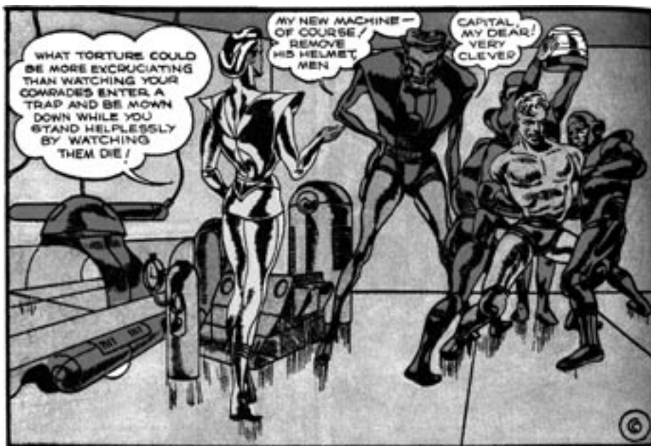
Kosminen Carson ja leveät haara-asennot.

Kirjasta löytyy lukuisia esimerkkejä myös selkeästi supersankareiden kastiin laskettavista hahmoista. Will Eisnerin ja Lou Finen The Flame (1939) on keltaiseen kopukuun ja punaiseen viittaa sonnustautunut rikollisten stoppari, joka hakkaa yli-inhimillisillä