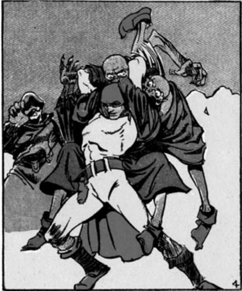
The Flame mättää rumiluksia minkä ehtii.

THE ODDS AGAINST HIM ARE TREMENDOUS, AND THE FLAME DARES NOT USE HIS GUN FOR FEAR OF INJURING THE POLICE . . . .