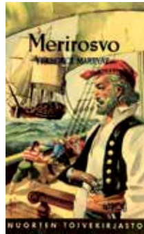
KIRJOIEN KANNET