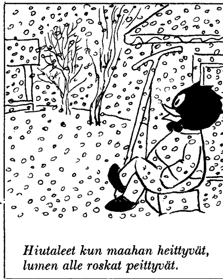
Hiutaleet kun maahan heittyvät, lumen alle roskat peittyvät.