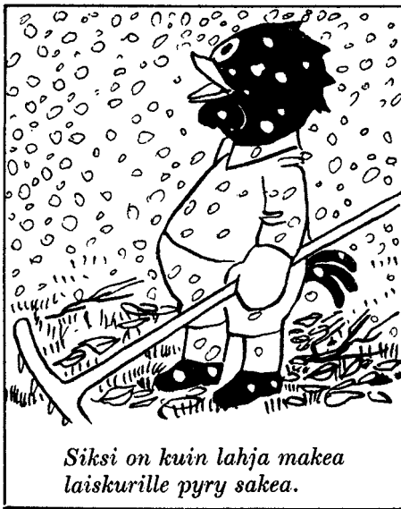
Siksi on kuin lahja makea laiskurille pyry sakea.