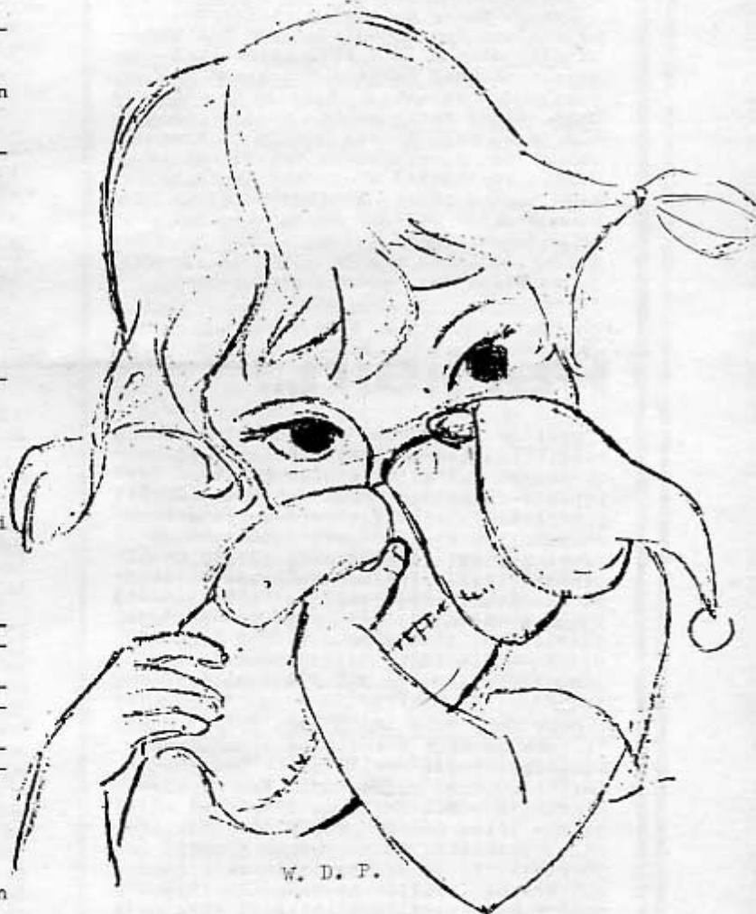
Pelastajien Penny on Disneyn ilmeikkäin ihmishahmo