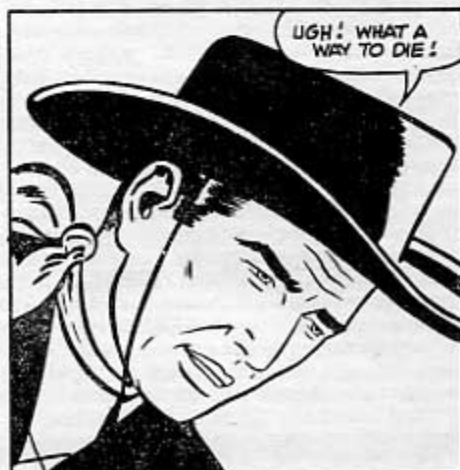
(Fawcett Movie Comic): "Lash" LaRue alias "Lasso" Larri

Fawcettin LASH LARUE WESTERN ilmestyi kuuden vuoden ajan, 1949-1954. Sen jälkeen Charlton Comics jatkoi sarjaa vielä parisen vuotta. Seikkailusarjoissa Lasso-Larri sooloili yhteensä 38 episodissa ja hänen filmihahmonsansa koristi 13 lehden kantta.