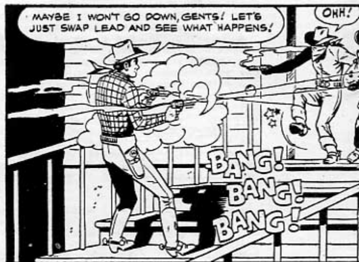
(Monte Hale Western): Seikkailusarjojen cowboytähdet eivät koskaan surmanneet vastustajaansa. Yleensä he vain ampuivat tältä pistoolin pois kädestä. Kuvassa Monte Hale.

Fawcettin lehdet olivat monivärisiä, mutta Seikkailusarjoissa säästettiin melkoisesti väriskaalassa. Loppua kohden värit kuitenkin paranivat. Seikkailusarjat olivat myös kooltaan pienempiä kuin alkuperäiset amerikkalaiset lehdet. Fawcettin lehdissä oli kansikuvina upeita kiiltäviä mainos- ja stillkuvia sankareiden filmeistä. Näitä onneksi käytettiin aluksi myös Seikkailusarjojen kansissa. Suosituimmat kansikuvapojat olivat miehekäs Allan "Rocky" Lane sekä elegantisti harmaantunut William Boyd Hopalong Cassidy n mustassa asussa. Tom Mixiä taas ei jostain syystä kelpuutettu Seikkailusarjojen kanteen kertaakaan.