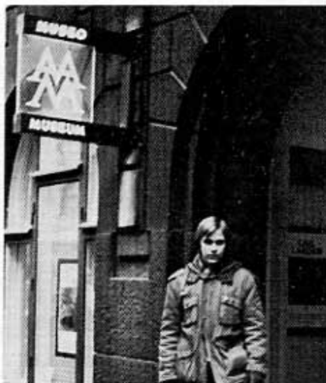
Amos Anderssonin museo

ensin oltiin-kiinnostuneita sarjakuvista?