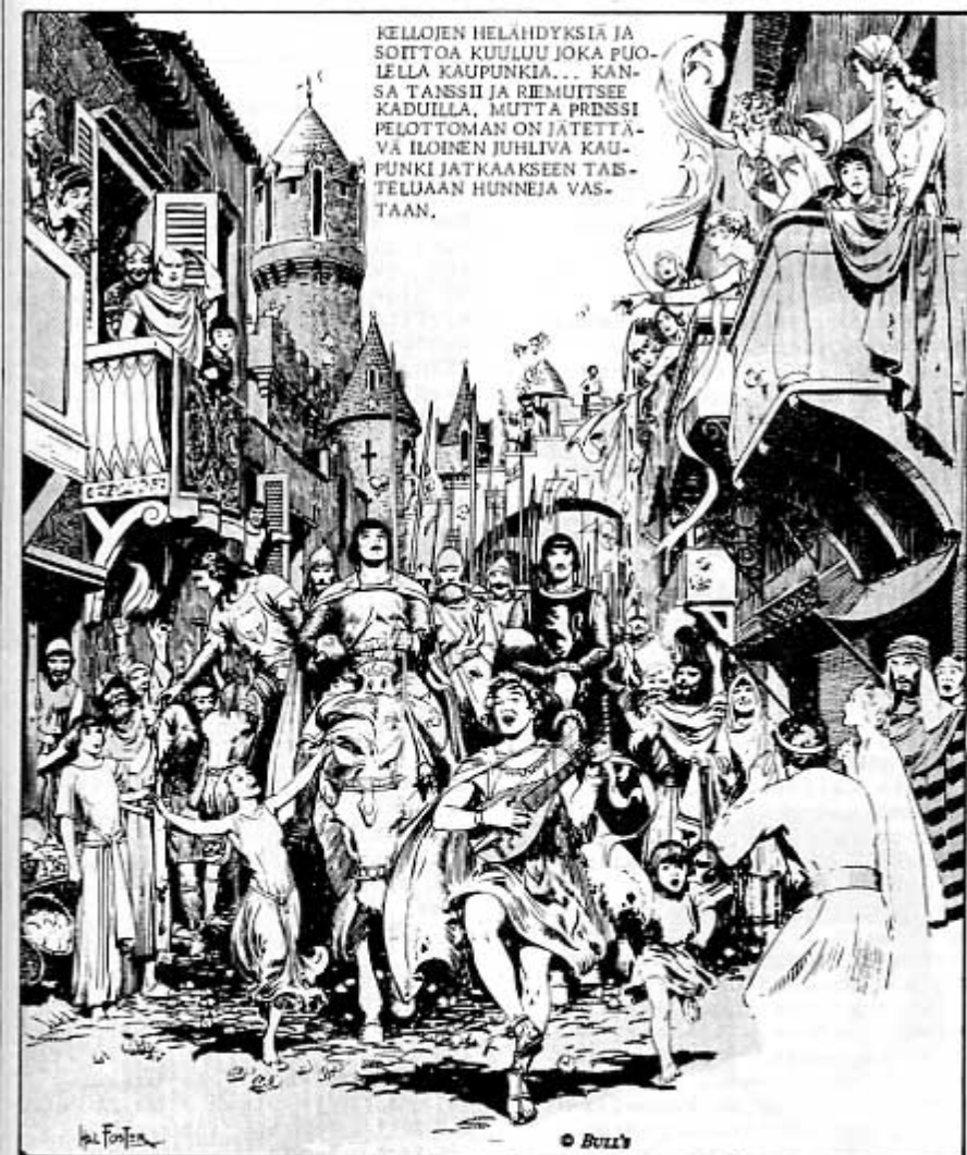
KELLOJEN HELÄHDYKSIÄ JA SOITTOA KUULUU JOKA PUOLELLA KAUPUNKIA... KANSA TANSSII JA RIEMUITSEE KADUILLA, MUTTA PRINSSI PELOTTOMAN ON JATETTAVA ILOINEN JUHLIVA KAUPUNKI JATKAAKSEEN TAISTELUAAN HUNNEJA VASTAAN.

Väritän sivuja siksi, että jotakin tekemistä pitää olla. Ei sitä voi noin vain vetäytyä