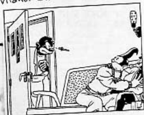
YOU MIGHT RUN ACROSS SOME OF YOUR OLD FRIENDS