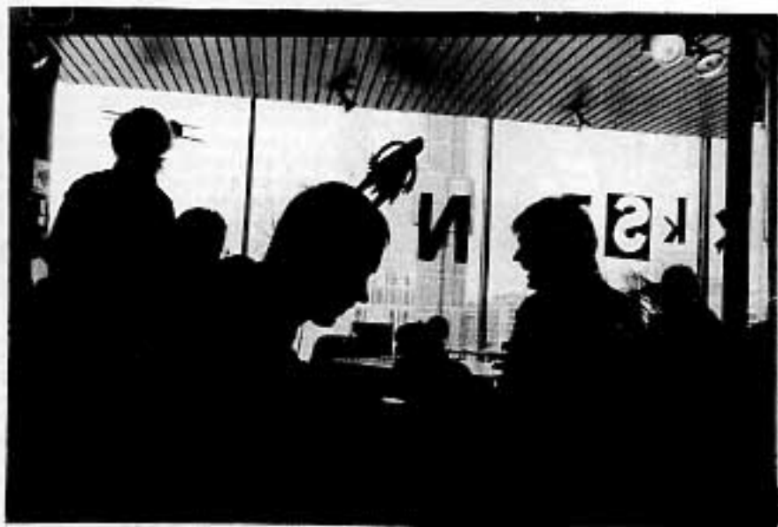
Kuvasi, tekstasi ja taittoi Jussi Karjalainen.