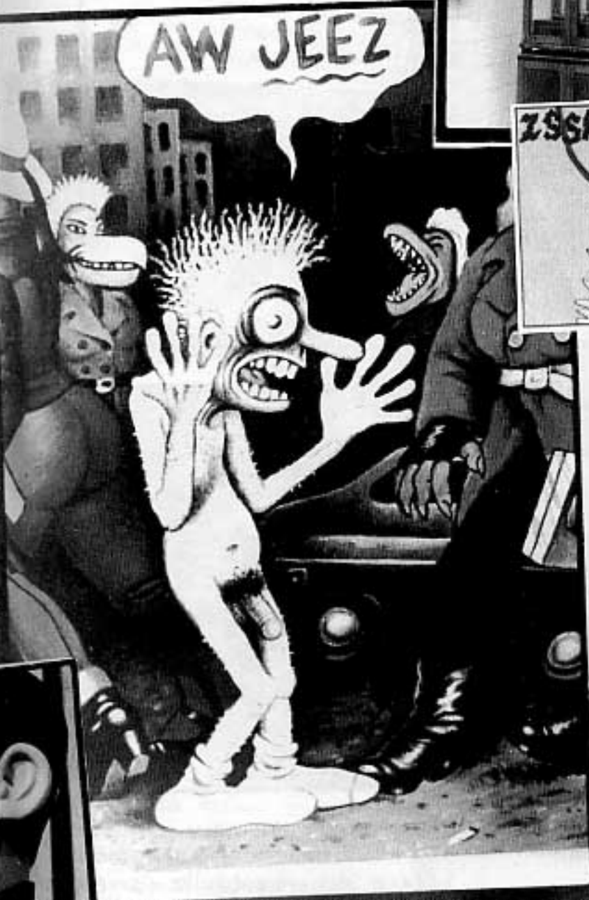
Robert Crumb oli käynyt kulhuksetissa maalaamassa oikean taulun, tyyliilleen uskollisena. Samoin tyyliilleen uskollisena taiteilija vältteli Ruotsissa käydessään onnistuneesti julkisuutta.