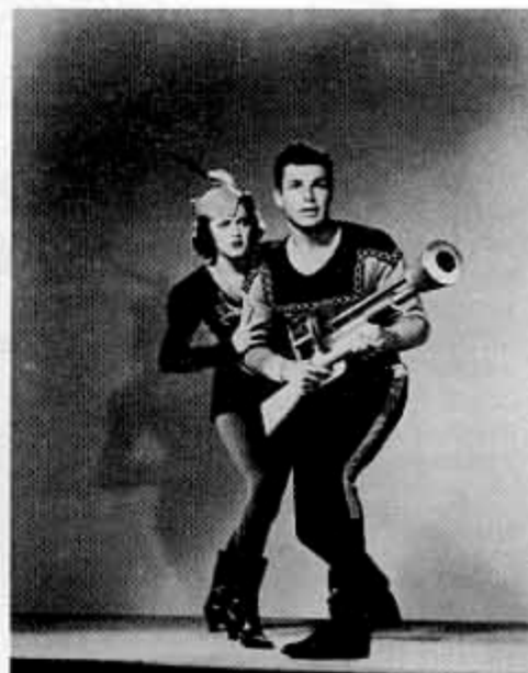
FLASH GORDON (BUSTER CRABBE)

Mikäpä siinä, lopputulos ei vain ole ollut kovin vakuuttava, mitä sarjakuvat sen si- jaan, oman maailmansa todellisuudessa, ovat usein. Parhaiten elokuvaksi sopivat sarjat, esimerkiksi Spirit , jossa jo itsensä on rankka itseironian ja parodian tuntu, eivät jostain syystä kiinnosta elokuvantekijöitä. He ehkä vain haluavat nauraa tyhmemmän veljen tyhmyydelle.