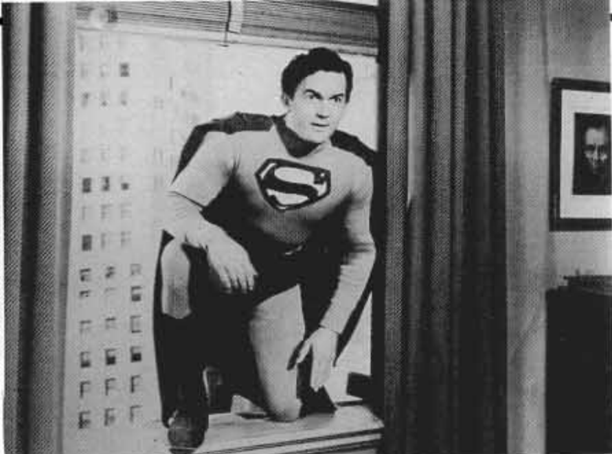
TERÄSMIES (KIRK ALYN)

Asialla on turha moralisoida. Hyvän eloku- van voi toki tehdä kirjan pohjalta, ja on tehty- kin. Merkillistä kyllä, mitä parempi kirja, sitä vaikeampi siitä on tehdä elokuva. Alfred Hitchcock ilmaisi asian näin keskustelles-