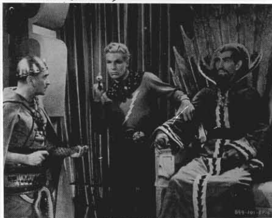
FLASH GORDON (BUSTER CRABBE)