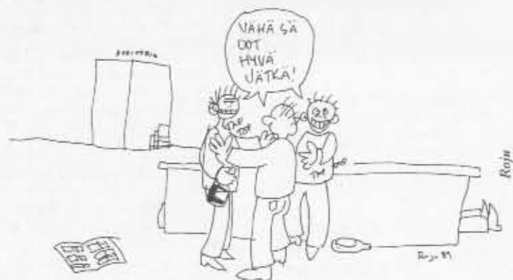
KESKINAISEN KEHUN KERHO

Kemin sarjakuvapäivät onnistuivat jälleen onnistumaan. Tämä ei ollut lainkaan varmaa, vain muutamia päiviä ennen festivaalia kaksi ulkomaisista vieraista peruutti tulonsa.