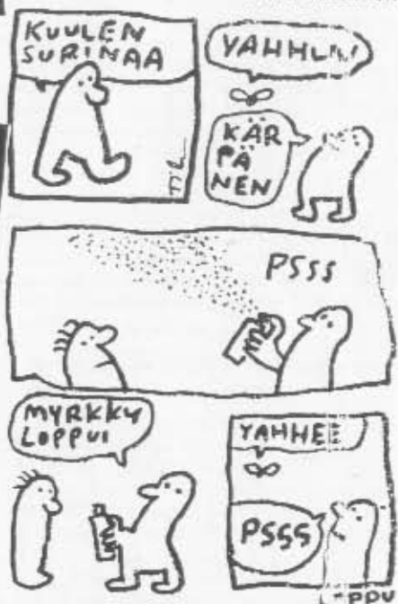
Nankabanjotaidetta sivurivijalta 1982–83.