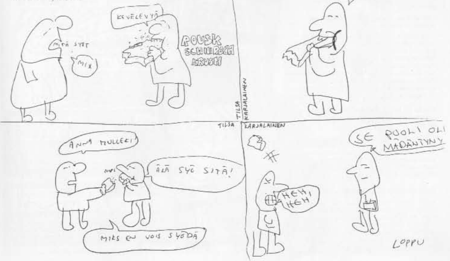
Tilisa ja Eero Karjalaisen nuorotyötä ammattikouluajoilta, 1979.

- No joku sitten sano jostain pätkästä, että "no ton mäkin olisin pystynyt itsekin keksimään". Entäs sitten? Ei kai se juttua pilaa, jos joku itsekin pystyi sen keksimään... itsehän mäkin ne keksin!