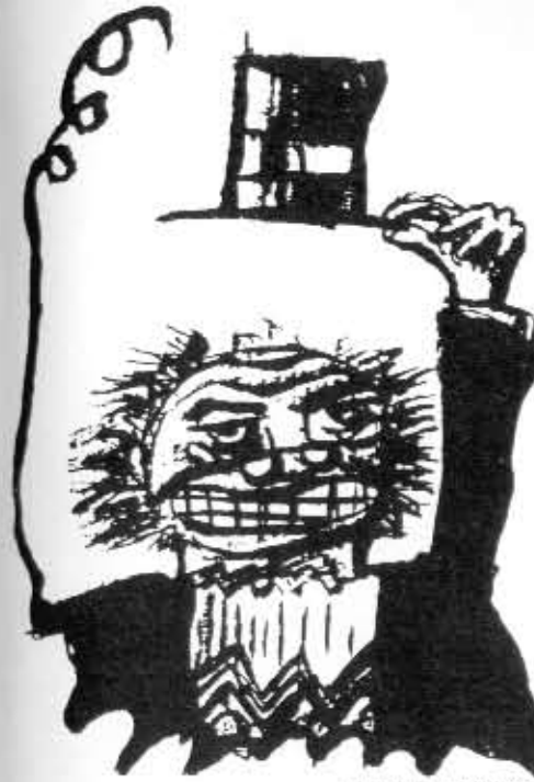
Sami Myllyniemi: Kärki 2/90