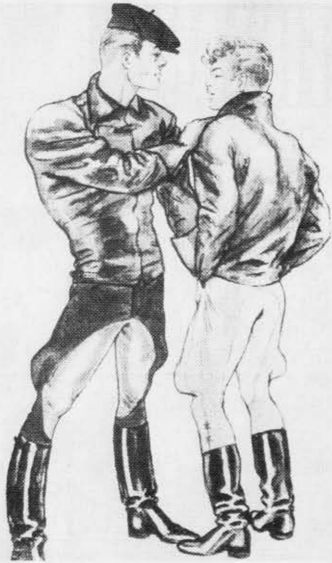
Tom of Finland 1947