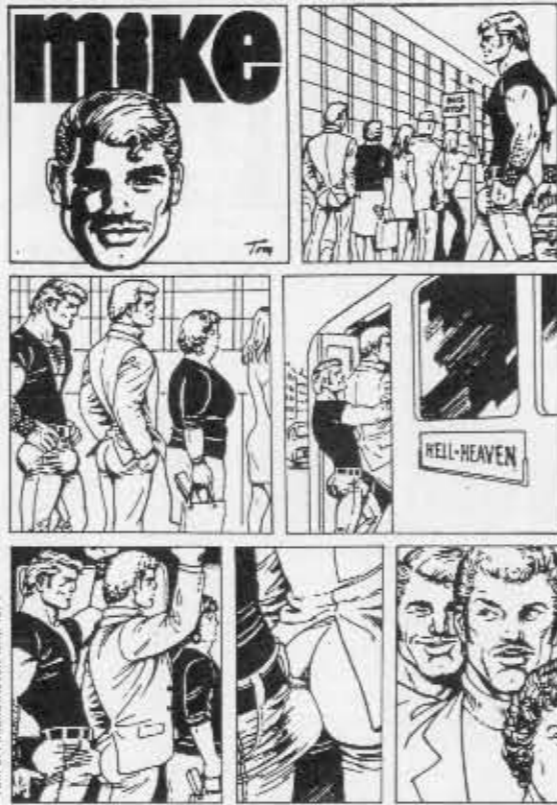
Tom of Finland -Revolt-lehti 1974

tuilla värillisiä kuvalehtiä kuten Body Beautiful ja Young Physique , ja niissä sai olla edestään päin alastomia poseerauskuvia.