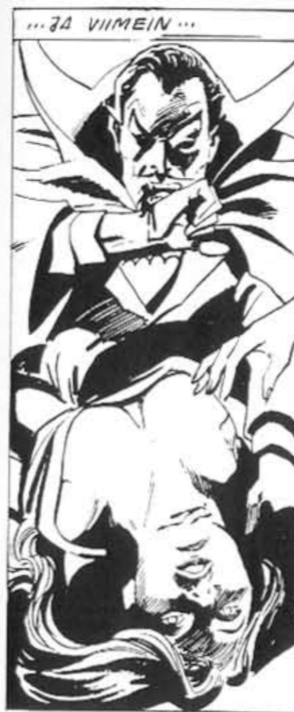
Vihdoinkin verta lehtien sivuilla! Gene Colan & Dick Giordano, Dracula 2/74.