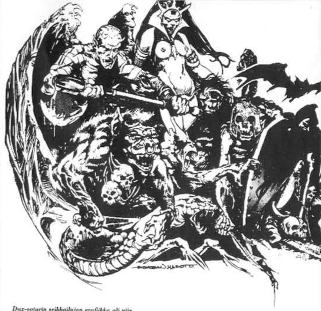
Dax-soturin seikkailujen grafiikka oli niin persoonallista, ettei siitä huonon painojäljen vuoksi saanut mitään selvää. Esteban Maroto, Shokki 7/73.

Parasta Marvel-kauhua kuitenkin Suomessa tarjoi Draculan nimikkolehti. Tuota Shokin kokoista ja tapaista, mutta hieman paremmin painettua lehteä ilmestyi tusinan verran, ja sen materiaali oli kautta linjan tasaisen laadukasta. Tarinat keskittyivät vampyyrikreivin edesotta-