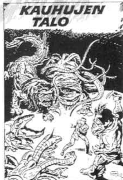
Vaikututtava mörköjä pursuileva täytetarina. Jack Kirby, Ihmesarja nro 42.

Niin koomisilla ja hasuilla kuin Shokki ja Kauhu tämän päivän perspektiivistä tarkasteltuna näyttävätkin, toimivat ne yhden kokonaisen sukupolven kauhukasvattajina. Niiden sivuilta levisi tieto vampyyreista, ihmissusista, ruumiinyöstäjästä ja hulluista tiedemiehistä.