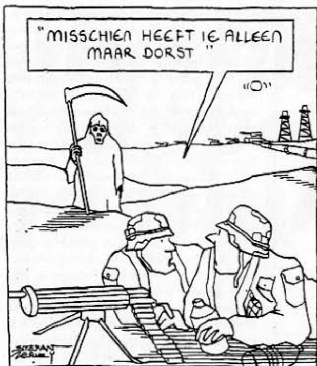
"Ehkä hänelläkin on vain jano"