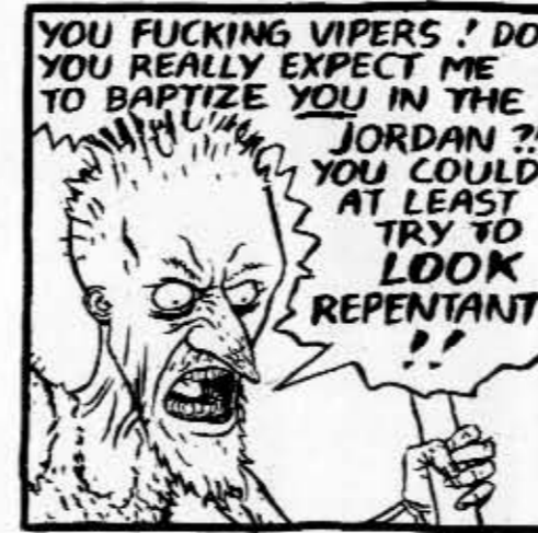
Johannes Kastaja vaahtoa.