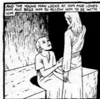
Markuksen salaisesta evankeliumista: Jeesus herättää kuolleista nimeltä mainitsemattoman nuoren miehen.