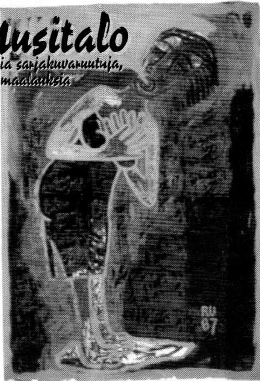
Suru. Akryyli ja lino paperille. Noin 2 m X 1,5 m.

Riitta Uusitalo ei nikottelematta enää kuulu tälle kehitysjanalle. Hän edustaa taiteilijaa, joka ei pyri nousemaan jonkin uuden -ismien harjalle. Pikemminkin hän haluaa sekoittaa tyylejä ja ilmaisutapoja. Hän ei halua myöntyä taiteessa luodulle säännöstölle, ei myöskään korkean ja massakulttuurin rajaehdoille. Elämä rajattomana mahdollisuutena on hänen luonnoskirjansa. Työhuoneessa ei enää tehdä luonnoksia - siellä syntyy valmiita.