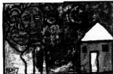
Miss Mary Brown ei katso taakseen. Akryyli ja lino paperille. Noin 1,5 m X 2,5 m.

Taiteen kehitys, sen avantgarde, on koko vuosisatamme ajan edennyt murroskohdasta murroskohtaan. Taide ja nuoren sukupolven esiin nostama anti-taite ovat otaneet mittaa toisistaan. Taiteen dynamiikka ja elinvoima nousee siis taistelusuhteesta, jossa vallalla oleva estetiikka kamppailee olemassaolostaan uuden ja vielä hahmottoman ilmaisun kanssa. Henkistyneen abstraktismin jälkeen tuli pop-taide, teoreettisen käsitetaiteen jälkeen hurja ekspressionismi, jne.