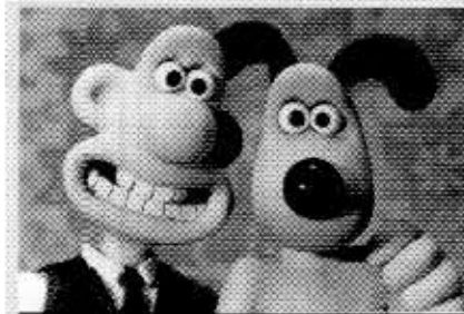
Nick Parkin hullun hauska Väärät housut voitti Tampereen kansainvälisen kilpailun pääpalkinnon.