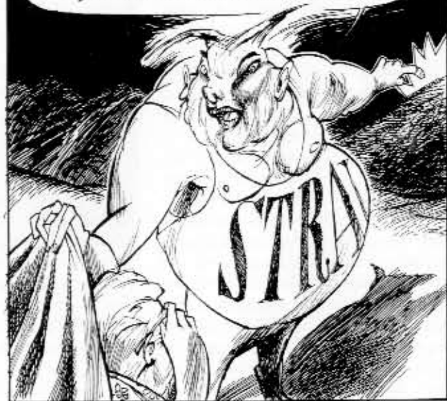
L'Avventura Milano (julkaisematon 1991)

Hälykännet kiinnostavat esittäjänsä huomion Puccini, sta succedendo qualcosa laggiu, meglio che vada a dare un'occhiata!