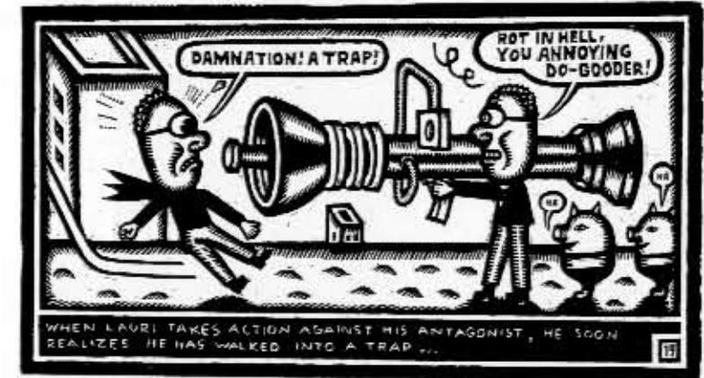
The Sinful Ways of Simpli City and the Birth of Lauri Kenttä, the Champion of God (Chacal Puant 1996)

"Mä koin aikanaan aika hankalaksi siirtymisen A4 sivukokoon, mikä oli pakko tehdä kun siirtyi muihin julkaisuihin. Siinä tulee ruutujen keskinäinen suhde